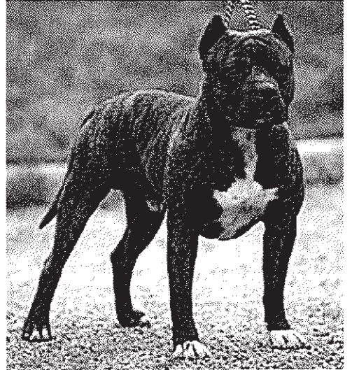
Straffords bul-terrier( Pit)